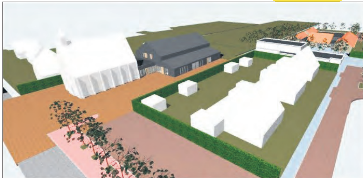
Van Manen en Swart iov Dorpsbelang Donkerbroek